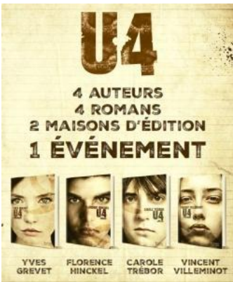
U4 (4 tomes) Yves Grevet / Vincent Villeminot Florence Hinckel / Carole Trébor