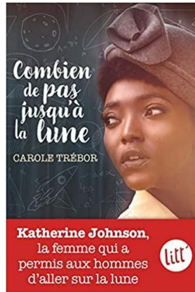
Combien de pas jusqu'à la lune Carole Trébor Albin Michel